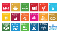
"Trasformare il nostro mondo: l'Agenda 2030 per lo Sviluppo Sostenibile" - UN 2015

È quindi in linea e raccoglie gli spunti forniti dai documenti internazionali e nazionali: