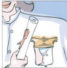
Essere sostenuti da operatori formati 经过训练和有资质的医务人员。 Help from healthcare staff الدعم من طرف عاملين بالصحة مدربين. योग्य स्तनपान के कर्मचारियों द्वारा प्रदान की मदद। Sprijiniți de personalul sanitar format