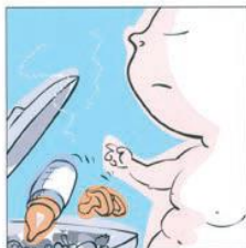
...senza interferenze ...无干扰。 ...without any interference ...عدم تدخل الجهات و الرضعات الاصطناعية. हस्तक्षेप के बिना ... ...fără intermediari