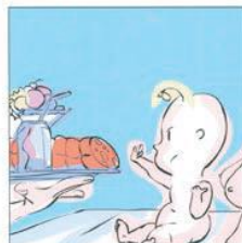
Allattare esclusivamente per 6 mesi e poi ...continuare 母乳哺育 6 个月... 然后继续。 Exclusive breastfeeding for 6 months and then ...continue it ارضعي طفلك فقط حليب الثدي لمدة ستة أشهر... وبعد ذلك اعطي المولود الاطعمة और फिर इसे जारी रखना। Alăptează în mod exclusiv în primele 6 luni și după ...nu ezita să continui