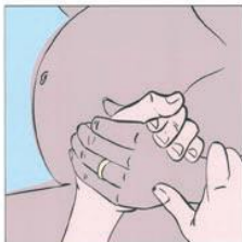
Partorire secondo natura 自然分娩。 Natural childbirth الولادة الطبيعية. प्रसाव के प्राकृतिक विधि। Nașterea: un proces natural