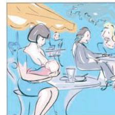
Potele allattare ed essere bene accolte ...ovunque 可以在任何场所母乳哺育，并深受好评...任何地方。 Able to breastfeed and be welcomed ...overywhere بمكانك ارضاع ابنك و الترحيب بكما ... في أي مكان. स्तनपान को सर्वत्र स्वागत करने में सक्षम। A putea alăpta și a fi bine văzute ...onunde