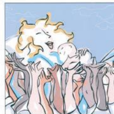
Trovare aiuto per essere sostenuti 寻找帮助和支持。 Find help and get support ابجد المساعدة و الدعم मदद के लिए मदद केन्द्रों। Găsește ajutor pentru a fi susținută