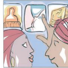
Scegliere informati 知识和选择。 The right to choose الاختيار من لديهم علم و خبرة. अपनी जरूरत के अनुसार जानकारी लेना। Alegeți în mod informat