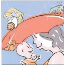
Essere protetti dalla pubblicità 被保护的宣传。 Protected from advertising الحماية من الإعلانات. प्रचार से वाकिफ होने के लिए। Protejeți de publicitate